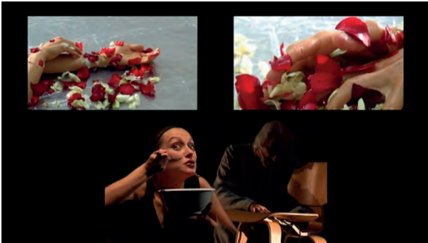
Un avatar del diavolo, foto di scena, “La question se pose de...”.