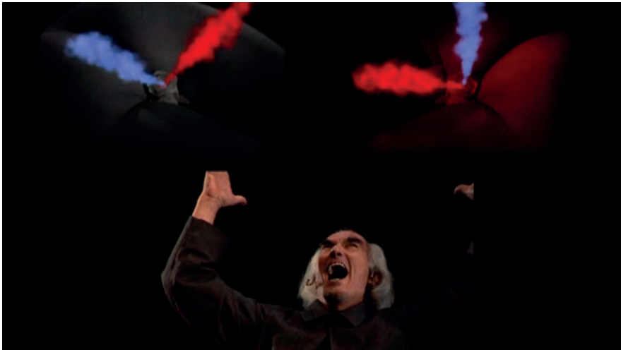
Un avatar del diavolo , foto di scena, “La recherche de la fécalité”.