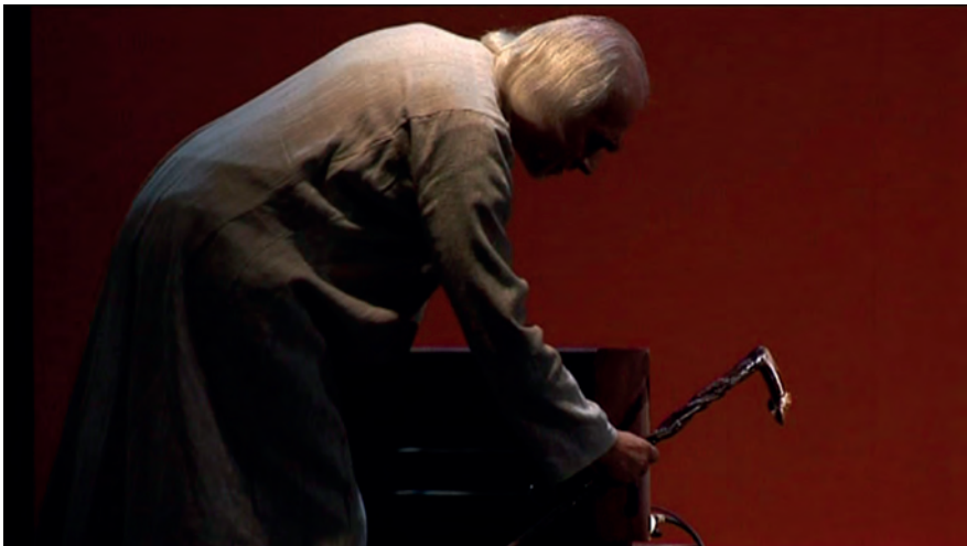
Un avatar del diavolo, foto di scena, “Conclusion”.