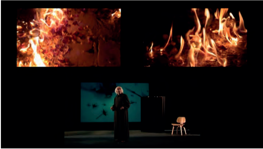
Un avatar del diavolo , foto di scena, “La recherche de la fécalité”.